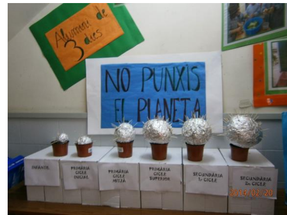
Recollida i representació simbòlica per conscienciar sobre l'ús de l'alumini (2013/14)