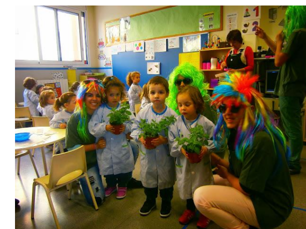
Skamot en acció.