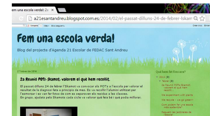
El blog d'A21E, del papallonari i L'e-twinning.

Racó d'A21E amb els acords presos a la reunió POT's i Skamot (2013/14)