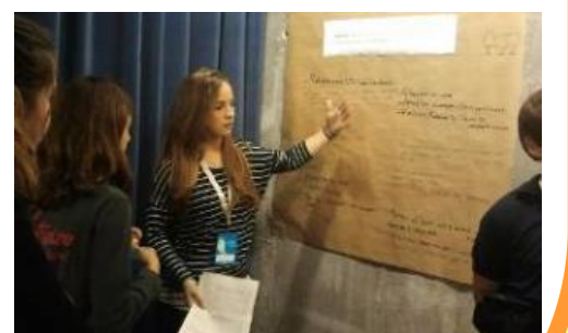
Cloenda A21E i Compromís ciutadà per la sostenibilitat (2013)