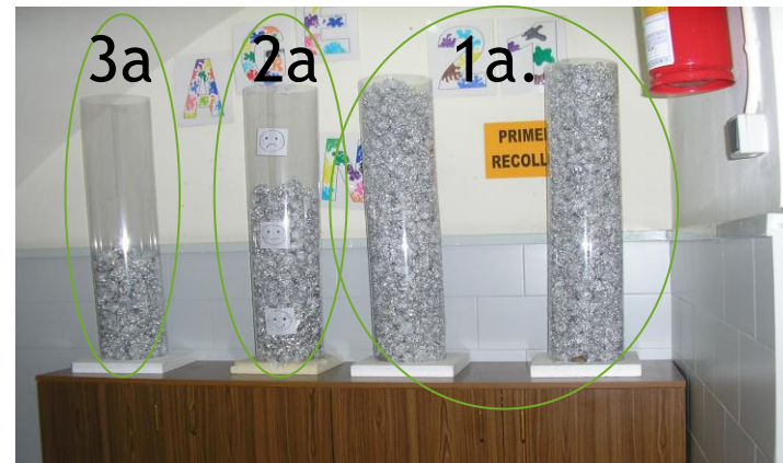
Les 3 recollides d'alumini que es van fer abans, durant i després de les activitats per reduir-ne l'ús (2010/11)