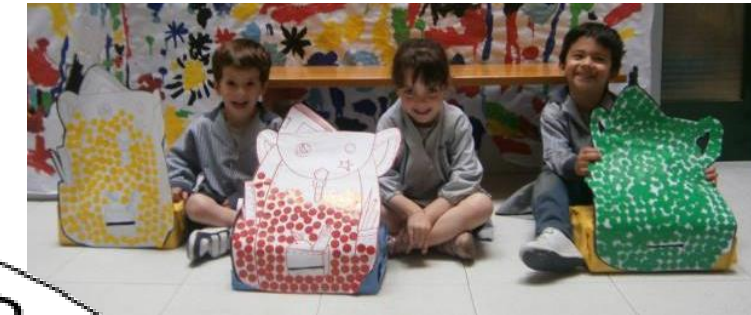
Votacions amb gomets després d'una diagnosi participativa per prioritzar els àmbits a treballar (2011/12)

=> Busquem estratègies per facilitar que tothom pugui dir la seva.