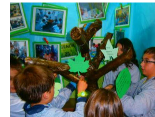
Arbre fet amb les fulles dels desitjos per al curs vinent de cada classe (2012/2013)