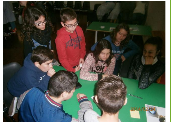
Reunions dels POTs (delegats d'A21E de 1r d'ESO a 2n d'ESO), Skamot (promotors d'A21E, 3r i 4t d'ESO) i professorat. És l'òrgan gestor del projecte.