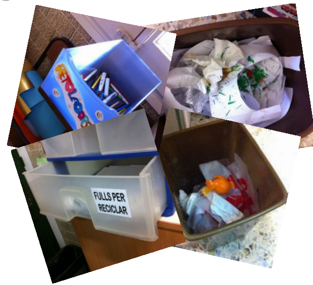
Diagnosi fotogràfica de l'estat de la recollida dels residus a l'escola (2013/14)

=> Representem els resultats de forma que tothom ho entengui, des dels més petits als més grans.