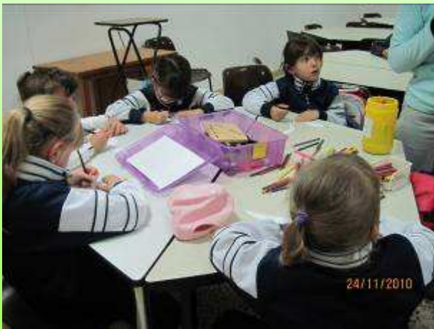
Els més menuts vam fer un mòbil d'una gavina