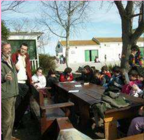
Escolars de Poble Nou i els Muntells a la reserva de Riet Vell

El delta de l'Ebre celebra el Dia de les Zones Humides