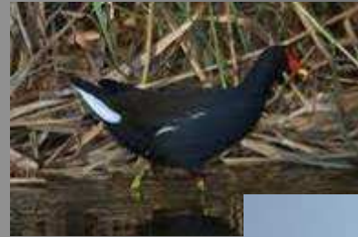
LA POLLA D'AIGUA